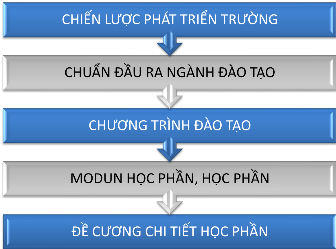
Hình 1: Lược đồ xây dựng Chương trình đào tạo